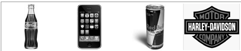
Abbildung 2: Beispiele für Produkte und Marken, die Kunden positiv emotionalisieren

Wenn man die Erfolgsgeschichte weltweit bekannter Produkte und Marken wie Coca-Cola, iPhone, Red Bull, Harley-Davidson und vieler anderer analysiert, stößt man auf ein bedeutendes Erfolgsprinzip: Kunden lieben diese Produkte, sie sind Kult, sie vermitteln Lebensgefühl, Freude und in der Summe: positive Emotion. Das verkauft.