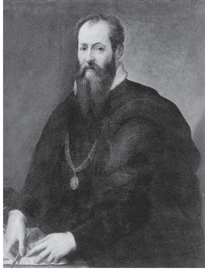
Abb. 1: Giorgio Vasari, Selbstporträt, um 1565, Florenz, Uffizien

als eigengesetzlicher, in sich geschlossener Epoche und als Beginn der Neuzeit ins Wanken bringen, auf Kontinuitäten mit dem Mittelalter verweisen und innere Brüche und Widersprüche herausarbeiten.