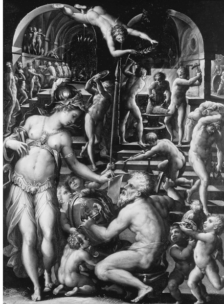
Abb. 2: Giorgio Vasari, Schmiede des Vulkan, um 1565, Florenz, Uffizien

licher Billigung und Förderung gegründet wurde. 30 Sie stand ganz im Zeichen der Kanonisierung und Kodifizierung jener Höchstleistungen, welche nach Vasaris Überzeugung die nicht zu überbietenden Meister der Hochrenaissance erbracht hatten. Wie auf Christus die Kirche, so folgte – wie Marco Ruffini kürzlich erläutert hat – für Vasari auf Raffael und Michelangelo die Accademia delle Arti del Disegno . 31 Diese verwaltete und vermittelte die durch das individuelle Ingenium der Meister erreichten Kunstmittel. Sie sorgte aber zugleich für einen effizienten, seriell und arbeitsteilig organisierten Betrieb der Kunst- und Bildproduktion, den Vasari mit einem seiner komplexen kunsttheoretischen Programmbilder – einem berühmten Beispiel seiner «Kunst über Kunst» – in eine mythische Vorzeit, in die Schmiede des Vulkan , verlegte (Abb. 2). 32