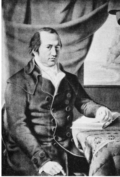
Johann Wolfgang Goethe, Gemälde von Heinrich Meyer, um 1795

literarischen Fachsimpeleien. Die übergroße Ehrfurcht fällt allmählich von ihm ab. Nur aus der Ferne glänzen die Sterne. «Kurz ich bin nicht mehr dum. Auch wird' ich mich jetzt vor keinem grossen Man mehr ängstlich bücken, blos vor den Tugendhaftesten.» Dass Herder, Wieland und Goethe, «die drei Thurmspizen unserer Litteratur», nicht sehr nah beieinander stehen, ist mit bloßem Auge erkennbar. Am 23. Juni ist Richter noch einmal bei Goethe geladen, der drei Tage später ins Tagebuch notiert: «Roman fertig». Es sind Wilhelm Meisters Lehrjahre .