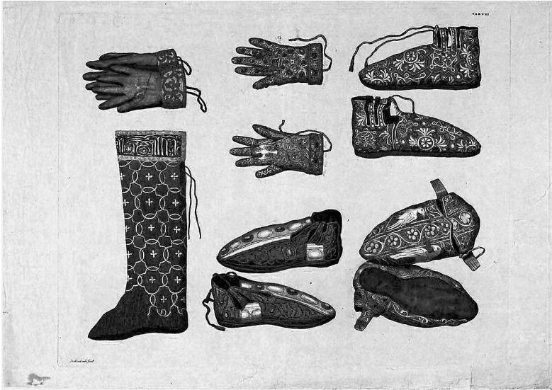
Krönungsornat: Strumpf, zwei Paar Handschuhe, drei Paar Schuhe