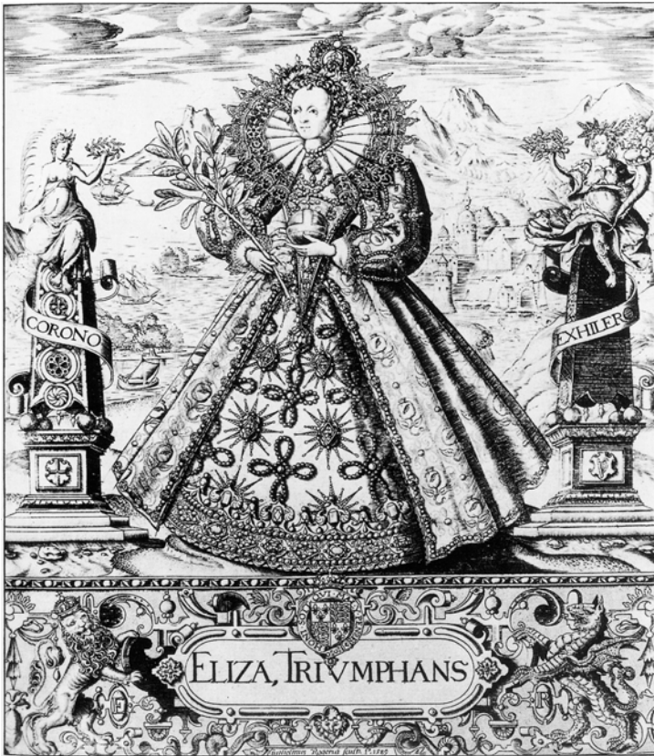
Eliza Triumphans. Kupferstich von William Roger (1589)