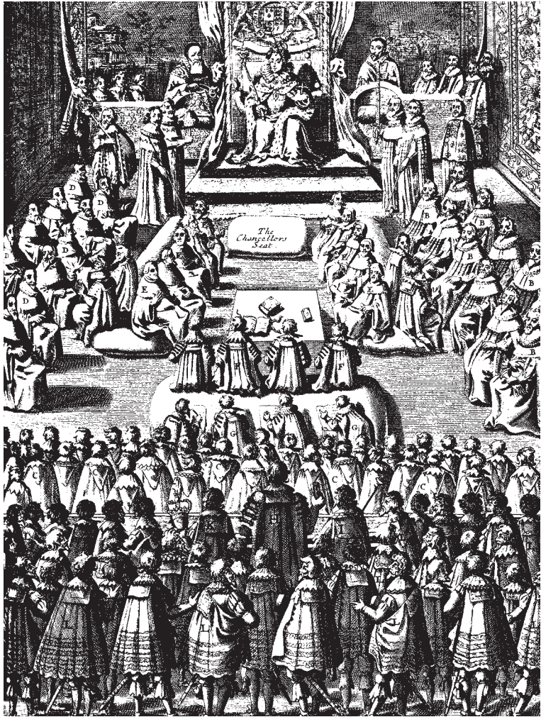
Elisabeth in ihrem Parlament. Zeitgenössischer Stich (Ausschnitt)

William Cecil, Elisabeths engster Berater und vierzig Jahre lang ihr informeller Regierungschef, trotz zeitweiliger Anfeindungen einen gesicherten Stand. Er wurde 1571 als Lord Burghley in den Adelsstand erhoben und blieb bis zu seinem Tod im Amt, das 1598 auf seinen zweiten Sohn Robert überging, den Jakob I. 1605 zum Viscount Salisbury adelte. Auch Elisabeths zweiter Staats-