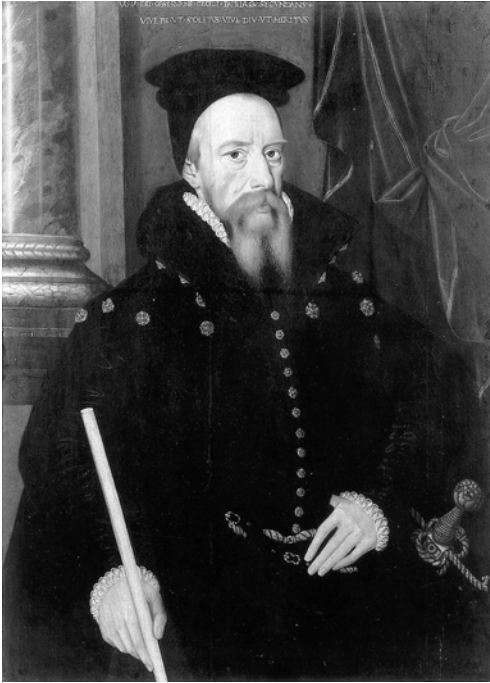
William Cecil. Porträt von oder nach Arnold van Brounckhorst (ca. 1560–1570)

sekretär, Sir Francis Walsingham, der als Organisator eines gut funktionierenden Geheimdienstes große Macht hatte, kam aus der Gentry, ebenso Christopher Hatton, der in den kritischen Jahren 1587 bis 1591, in denen mit der Hinrichtung Maria Stuarts und dem Angriff der Spanischen Armada viel auf dem Spiel stand, das Amt des Lordkanzlers innehatte. Weitere einflussreiche Vertreter des niederen Adels waren Sir Thomas Gresham, der Gründer der Royal Exchange und zeitweilig der heimliche Finanzminister des Landes, sowie zwei der drei Hauptverantwortlichen für den Sieg über die Armada, Sir John Hawkins und Sir Francis Drake, die nur noch den aus dem Hochadel stammenden Admiral Charles Howard, Graf Nottingham, über sich hatten.