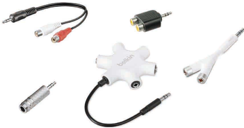
Eine kleine Auswahl an Adaptern für den Kopfhöreranschluss.

Adapter und Kabel bekommen Sie direkt bei Apple und Apple-Verkaufsstellen und im Fach- und Versandhandel. Da Original-Apple-Produkte recht teuer sind, gibt es viele Alternativprodukte von Fremdherstellern. Auch hier gilt: Vorsicht bei Billigprodukten! Billigkabel brechen nach kurzer Zeit und sind oft nicht passgenau. Zahlen Sie lieber etwas mehr und kaufen Sie Markenprodukte.