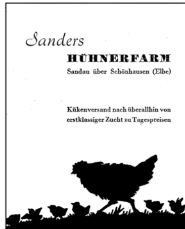
Abb. 6 Beispiel für eine Werbeanzeige aus der Zeitschrift „Graphische Nachrichten“

Grams spricht schließlich den zusätzlichen Aspekt an, wie sich bei Schattenbild-Illustrationen die Schrift zum Bild verhalten sollte, damit eine ansprechende Wirkung erzielt wird: