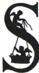
Abb. 3 Adele Schopenhauer: Buchstabe des Scherenschnitt-Alphabets, 1820