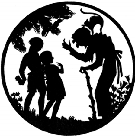
Abb. 5 Elsa Dittmann: Hänsel und Gretel, Illustrationsbeispiel der Zeitschrift „Graphische Nachrichten“

Ansprechend wäre zudem die Fragestellung, ob die oben genannten Vorurteile gegenüber dem Scherenschnitt dazu führten, dass die Schattenbild- und Scherenschnitt-Illustration bislang wenig wissenschaftlich untersucht wurde.