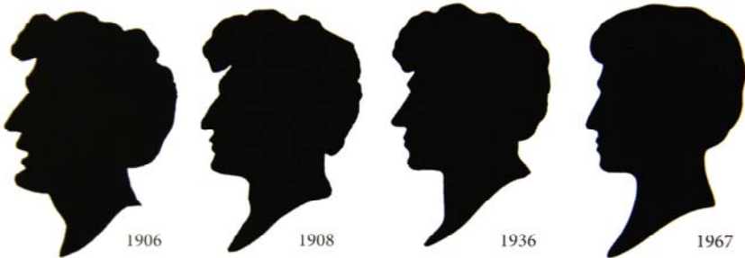
Abb. 4 Logo der Firma Schwarzkopf im Wandel der Zeit, 1906–1967

Mit dieser Aussage kann nur die Firma „Schwarzkopf“ gemeint sein, die das schwarze Profilbildnis bis heute, in jeweils dem Zeitgeist angepasster Form, als Logo einsetzt (vgl. Abb. 4). Dieses Beispiel liefert uns damit auch sogleich einen unmittelbaren Beleg zu der Aussage zur Zeitlosigkeit des Scherenschnittes in der Werbung.