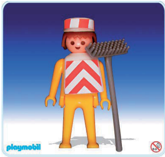
Abbildung 4: Produktabbildung Bauarbeiter 3219-A

Die ersten Figuren stellten Bauarbeiter, Indianer und Ritter dar und deckten damit die Aspekte des Historischen, des Aktuellen und der fremden Kultur ab. Doch bis zu der Realisierung der Idee sollte es noch dauern. Beeinflusst vom Kostendruck aus Niedriglohnländern und Ölkrise stimmte Horst Brandstätter schließlich der Realisierung der Idee zu und im Februar 1974 wurden die Playmobilfiguren vorgestellt.