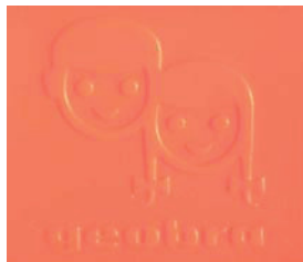
Abbildung 3: Markenlogo Geobra

Während der Entwicklung gab es verschiedene Probleme zu lösen. Die Greifhand musste entwickelt werden, das Gesicht, das anfangs sogar noch eine Nase hatte und einzeln bewegliche Beine wurden diskutiert, aber wegen der Instabilität verworfen, finden sich aber noch in der Patentanmeldung. Ein großes Problem war die Kompatibilität zu anderem Zubehör. Augenfällig ist etwa die schmale Taille des Playmobilpferdes, das eben den Beinabständen der Figur geschuldet ist. Die Größe der Figur wurde wiederum an den Maßen der Kinderhand angelehnt, wie Hans Beck in einem Interview darlegte 1 . An der Gestaltung des Gesichts mit dem freundlichen Lächeln orientierte er sich für das damalige Firmenlogo.