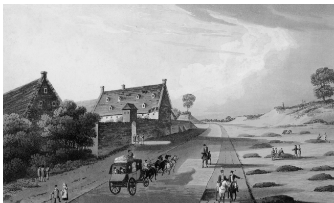
La Haye Sainte an der Straße Brüssel–Charleroi, um 1815. Diese Ansicht ist vermutlich erst nach der Schlacht bei Waterloo entstanden.

Zeitweise kamen die Franzosen bis auf hundert Schritt an die Deutschen heran. Um die feindliche Kavallerie abzuwehren, war das Bataillon mehr als einmal gezwungen, zu halten und im Karree Aufstellung zu nehmen, die Flanken starrend von Säbelbajonetten. Die Soldaten wären sehr erstaunt gewesen, wenn sie in Wellingtons späterem Bericht gelesen hätten, der Feind habe nach der Schlacht bei Quatre Bras «nicht versucht, den Rückmarsch zu behindern». 9