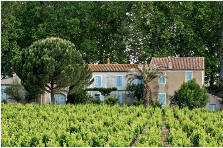
Weingärten um Lézignan-Corbières.