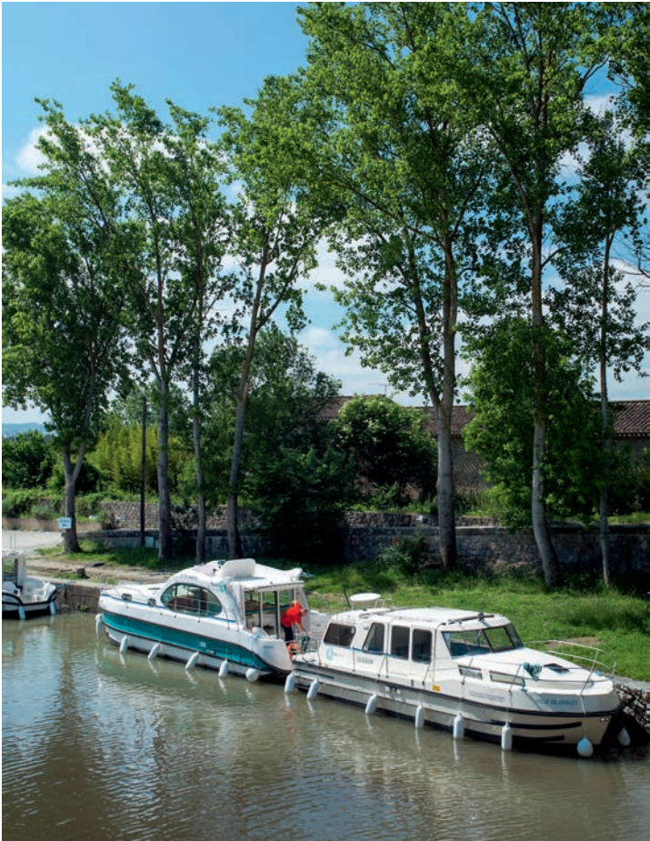
Der Canal du Midi – Magnet für Wasserreisende.

Flüsse und Kanäle wurden in Frankreich schon im Mittelalter zu wirtschaftlichen und militärischen Zwecken ausgebaut, angelegt und miteinander verbunden. Im 19. Jahrhundert hatten die Binnenwasserstraßen eine Gesamtlänge von 11 000 Kilometern. Doch durch den Bau der Eisenbahn und später den Straßenbau verloren die Wasserwege an Bedeutung. Erst mit dem aufstrebenden Wassertourismus erlebten sie seit den 1960er-Jahren einen neuen Aufschwung. Heute gibt es noch rund 8500 Kilometer Wasserstraßen, die fast ausschließlich der staatlichen »Voies navigables de France« (VNF), der Wasserstraßenverwaltung, unterstehen.