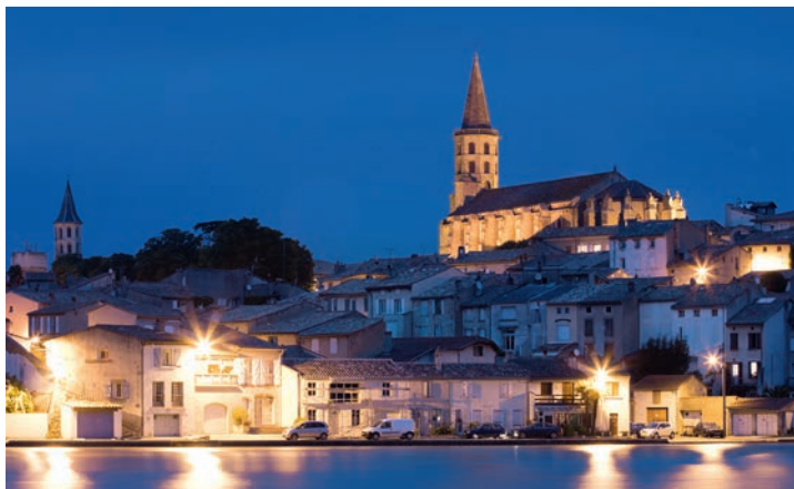
Entlang des Kanals gibt es viele beeindruckende historische Bauwerke, wie St. Michel in Castelnaudary.