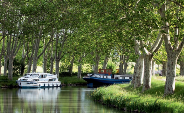
Wie eine lange baumbestandene Allee wirkt der Canal du Midi auf weiten Abschnitten.

wurden später durch Maulbeerbäume ersetzt, die man für die Seidenproduktion benötigte; ihnen folgten italienische Pappeln und schließlich Obstbäume. Für den Nachschub sorgten Baumschulen, die in der Nähe des Kanals angelegt worden waren. Anfang des 19. Jahrhunderts entschied man sich dann für die Aufforstung mit Platanen, da deren Wurzeln eine wirkungsvolle Befestigung der Ufer gewährleisteten. Darüber hinaus vermindert ihr Blätterdach die Verdunstung des Kanalwassers und spendete auf den Treidelpfaden Schatten für Menschen und Zugpferde.