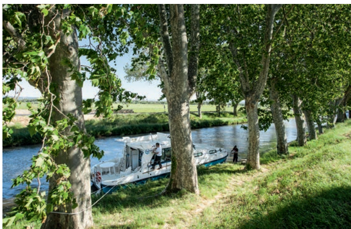
Es gibt genug Häfen, aber es darf auch einfach am Ufer festgemacht werden.

Am Canal du Midi gibt es zahlreiche Häfen und Versorgungsstationen, Tankstellen und Frischwasser, aber auch Fahrrad- und Mopedverleihe sowie gute Bus- und Bahnverbindungen. Vier Naturparks, Freizeit- und Wasserparks, Golfplätze, Surf- und Kiteschulen und der 200 Kilometer lange Sandstrand erfüllen sämtliche Urlaubs- und Erholungswünsche.