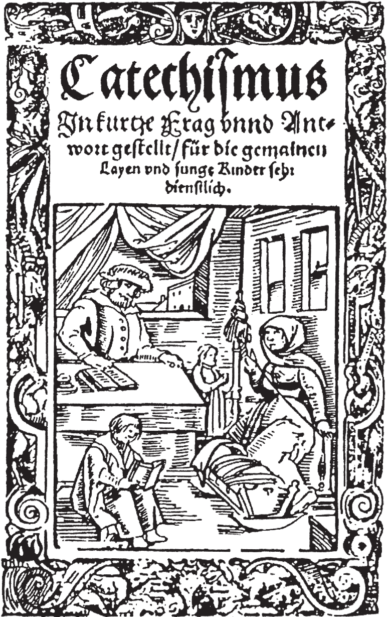
Abb. 1: Familienkatechese 1595. Holzschnitt. Buchillustration