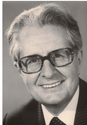
Dr. Hans-Jochen Vogel