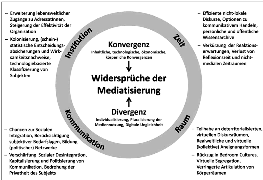
Abb. 1 Widersprüche der Mediatisierung in den Dimensionen Zeit, Raum, Kommunikation und Institution

Es scheint mir nun, dass die zunehmende Ambivalenz gegenüber Mediatisierungsprozessen nicht alleine einer Überforderung analytischer Kategorien bzw. dem Problem fehlender historischer Distanz geschuldet ist, sondern auf tatsächlich in höchstem Maße widersprüchliche Phänomene bzw. Effekte sozio-medientechnologischer Entwicklungen zurückzuführen ist. In vorliegendem Beitrag wird die These vertreten, dass es für die Positionierung der Sozialen Arbeit gegenüber den neuen Medientechnologien und der Formulierung möglicher Zugänge bzw. Adaptierungen ein zentrales Unterfangen ist, die Ursachen der Widersprüchlichkeiten der Mediatisierung zu verstehen und ihre Folgen zu beschreiben.