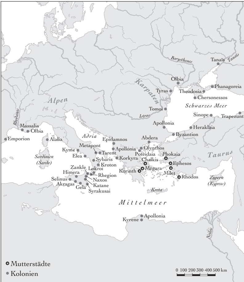
Karte 1: Griechische Auswanderung