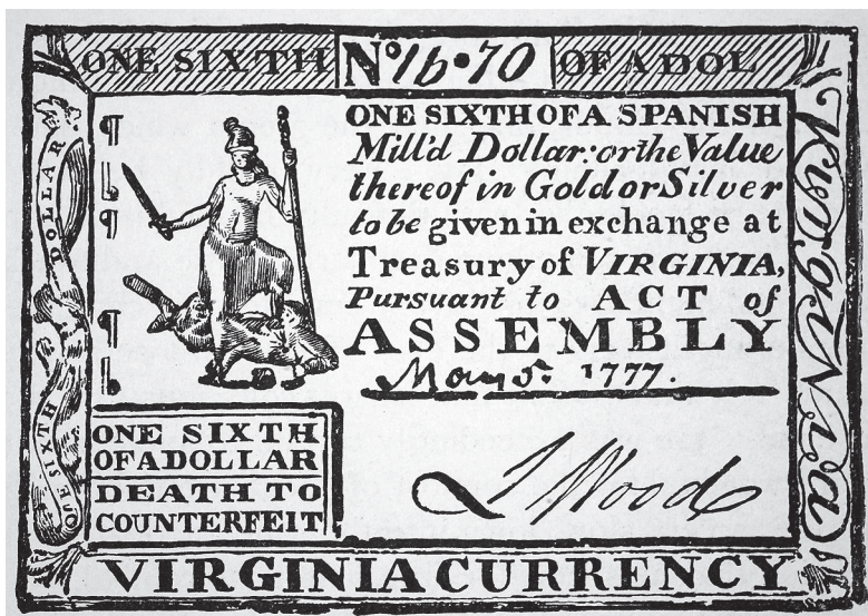
Geldschein des Staates Virginia, 1777. Diese Banknote entsprach einem Sechstel eines spanischen Dollars.

Mais für den Eigenbedarf produziert wurden. Und im Schiffbau waren die Amerikaner den Briten dicht auf der Spur.