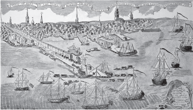
Hafensicht von Boston um 1770, handkolorierter Stich von Paul Revere, 1768.