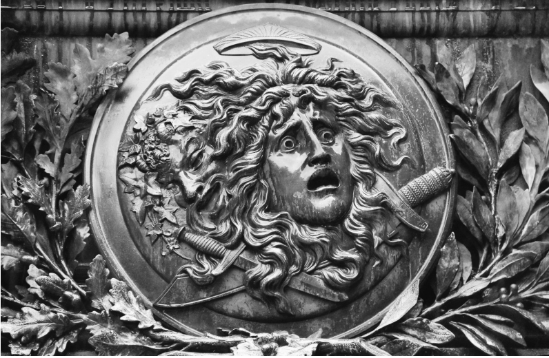
Medaillon am Sockel der Schillerstatue auf dem Wiener Schillerplatz

Schillers Dichtung übernahm Zweig die Lehre, die seiner Moralphilosophie zugrunde lag, dass sich nämlich die Freiheit nur im Reich der Träume verwirklichen lässt, so wie wahre Schönheit nur im Gesang zur Blüte kommt.