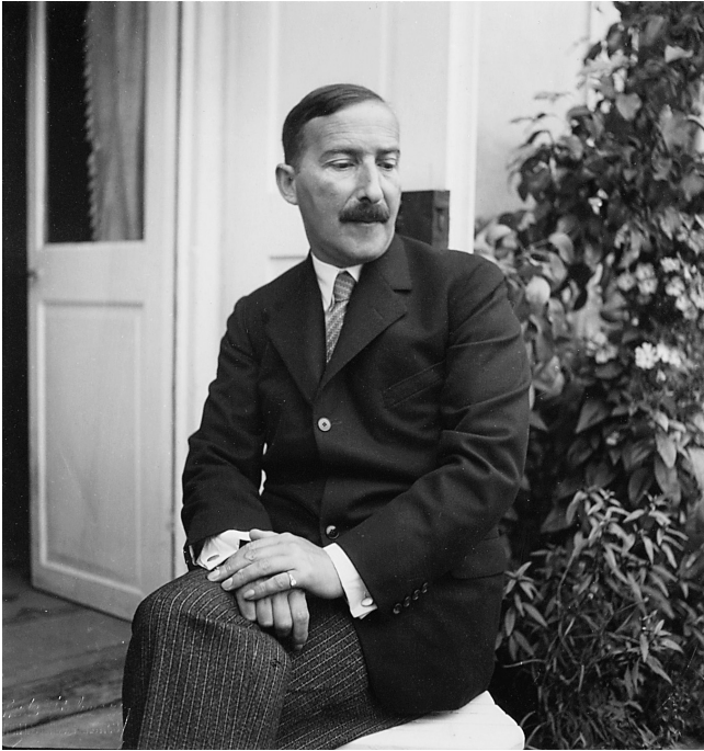
Stefan Zweig in Salzburg, Sommer 1931

Welche Rolle spielt Politik in der Kunst? Und welcher Ort kommt der Kunst in der Bildung zu? Seine Geschichte wirft überdies Fragen danach auf, wie wir irgendwo zugehörig werden – wie verhalten sich die Verantwortung gegenüber der Familie und den ethnischen Wurzeln und die Ideale des Kosmopolitismus zueinander? Die Zahl der Leben, mit denen Zweig über sein Schreiben in Berührung kam, und die Zufluchtsstätte, zu der er die Terrasse seines Hauses am Salzburger Kapuzinerberg machte, wo unzählige Humanisten und Künstler aus Europa im Schatten der Bäume saßen und redeten, machten Zweig zu einem Katalysator und Vermittler von Denkströmungen, die für seine Epoche von zentraler Bedeutung waren. «Begegnen wir der Zeit, wie sie uns sucht», lautet das Eingangsmotto seiner Autobiographie. Diese Verse aus Shakespeares Cymbeline lassen sich mit Blick auf die Lebensgeschichte Stefan Zweigs unter-