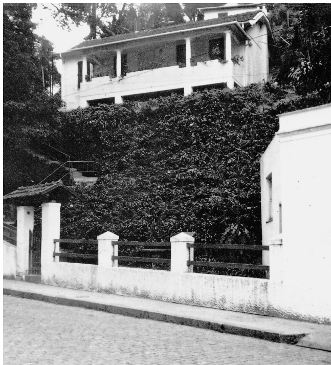
Rua Gonçalves Dias in Petrópolis zu der Zeit, als die Zweigs dort wohnten

an der er gerade saß. Drinnen mühte sich das Hausmädchen mit dem qualmenden Holzofen.