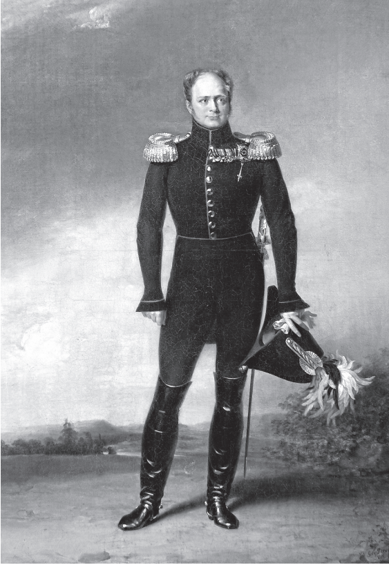
Zar Alexander I., der hoffte, dass eine von christlichen Prinzipien geleitete Regierung die von der Französischen Revolution entfesselten Kräfte des Bösen besiegen wird. Porträt von George Dawe.

vorbereitete, träumte er von einem geruhsamen Leben als Privatier irgendwo in Deutschland.