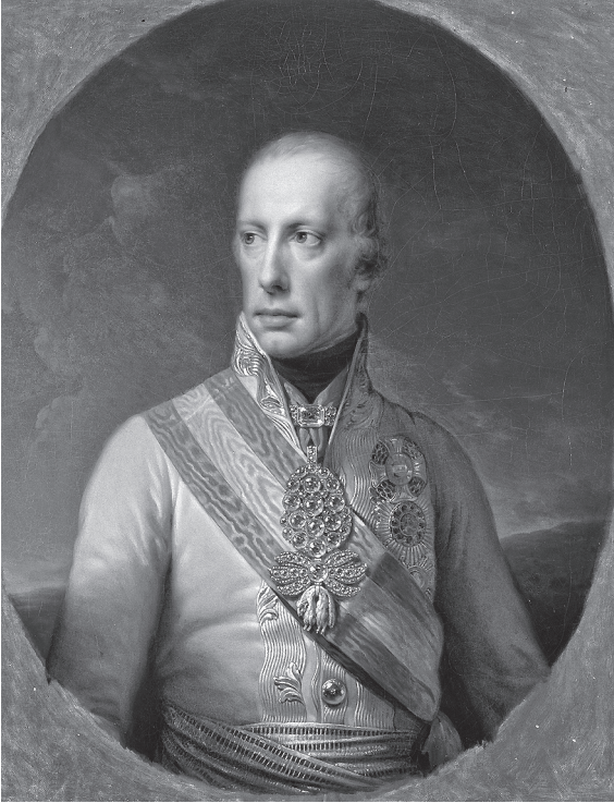
Franz II., Kaiser des Heiligen Römischen Reiches, der in der Aufklärung eine freimaurerische Verschwörung sah, mit der die Religion unterminiert und die Gesellschaftsordnung gestürzt werden sollte. Porträt von Johann Baptist Edler von Lampi, 1816.

Franz glaubte ehrlich, die Aufklärung sei ein Schwindel, vor dem seine unwissenden Untertanen geschützt werden müssten. Er fand Bildung an und für sich gefährlich und betrachtete jedes private philanthropische Engagement mit tiefem Misstrauen. Nach seiner Ansicht sollten die Menschen in niemandes Obhut als der ihres gottgegebenen Monarchen verharren. Wenige Tage nach der Thronbesteigung wies er die Polizei an, die Ausbreitung der «fanatischen Pseudo-Aufklärung» und aller anderen Ideen, welche die öffentliche Ordnung gefährdeten, unablässig und umfassend zu beobachten, denn dies sei die Hauptaufgabe des Staates. 16