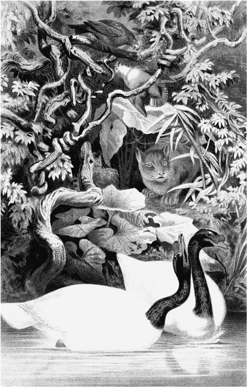
Saum eines europäischen Waldes. Alfred Edmund Brehm, 1883–1884.