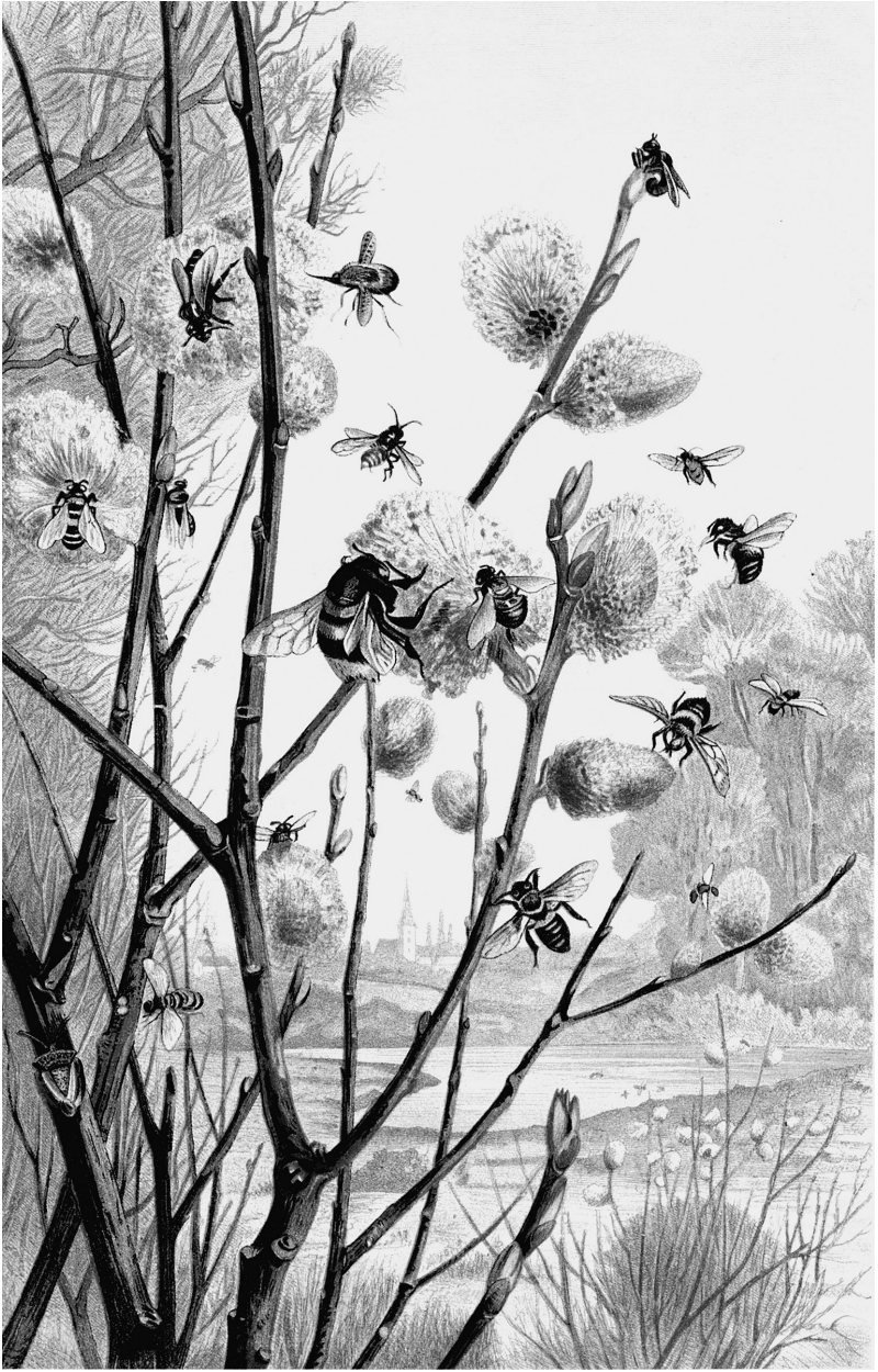
Bienen, Hummeln und Blumen. Alfred Edmund Brehm, 1883–1884.