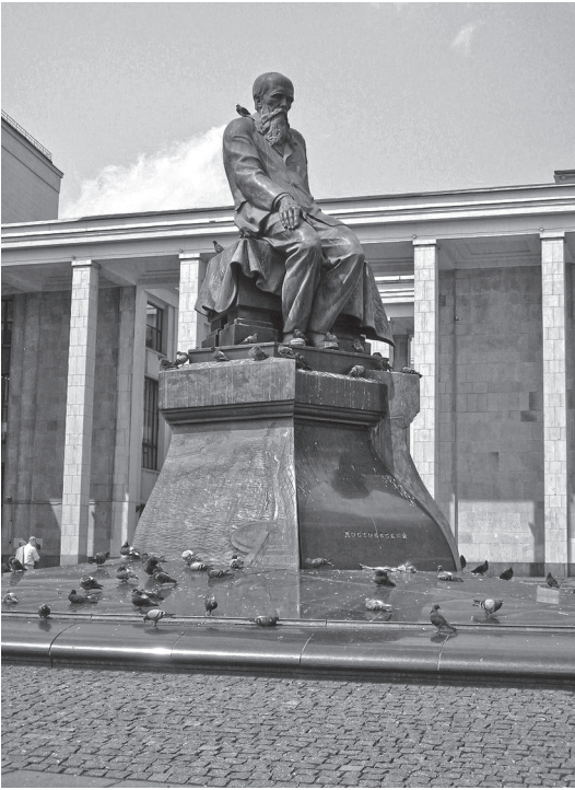
Dostojewskij-Denkmal von A. Rukawischnikow vor der Russischen Staatsbibliothek in Moskau

dels jedoch, das in den öffentlichen Räumen Russlands schon immer eine größere Rolle gespielt hat als in Westeuropa, ist ein Richtungswechsel unübersehbar. Er zeigt sich in den vielen Dostojewskij gewidmeten Denkmälern, Museen, Gedenktafeln, Straßen und Plätzen ebenso wie in den mehr als zwanzigtausend seither restaurierten oder neu errichteten Klöstern und Kirchen, nicht zuletzt aber auch in der ostentativen Frömmigkeit, mit der die Kreml-Elite neuerdings bei hohen Kirchenfesten, so wie einst die politische Klasse des Zarenreiches, den orthodoxen Ritus zelebriert. Inzwischen beherrscht sie dieses Ritual jedenfalls sicherer als seinerzeit Boris Jelzin, dem es noch schwerfiel, Ostern und Weihnachten auseinanderzuhalten. Mehr als alle anderen Politiker seiner Generation steht für diesen Wandel im postsowjetischen Russland Wladimir Putin. Nachdem er 1996 seine Töchter aus der brennenden Familiendatscha gerettet hatte, fand man in den verkohlten Trümmern das unversehrte