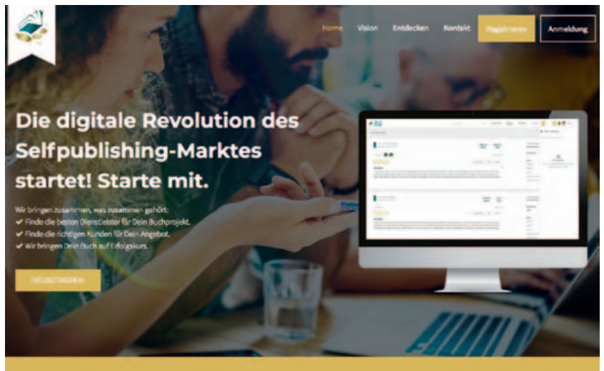
Screenshot der Startseite

plattform für Autorinnen und ihre Teams gibt, auf der man gemeinsam und vor allem sicher an Buchprojekten arbeiten kann. Eines unserer großen Ziele ist es deshalb auch, Vorreiter in Sachen Datenschutz zu sein.