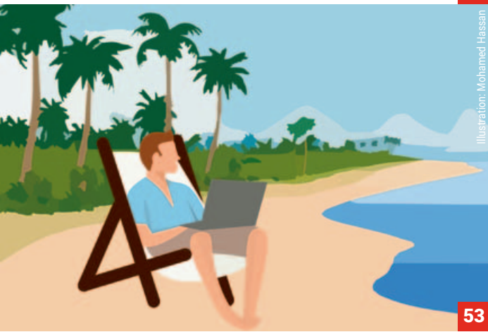
Illustration: Mohamed Hassan