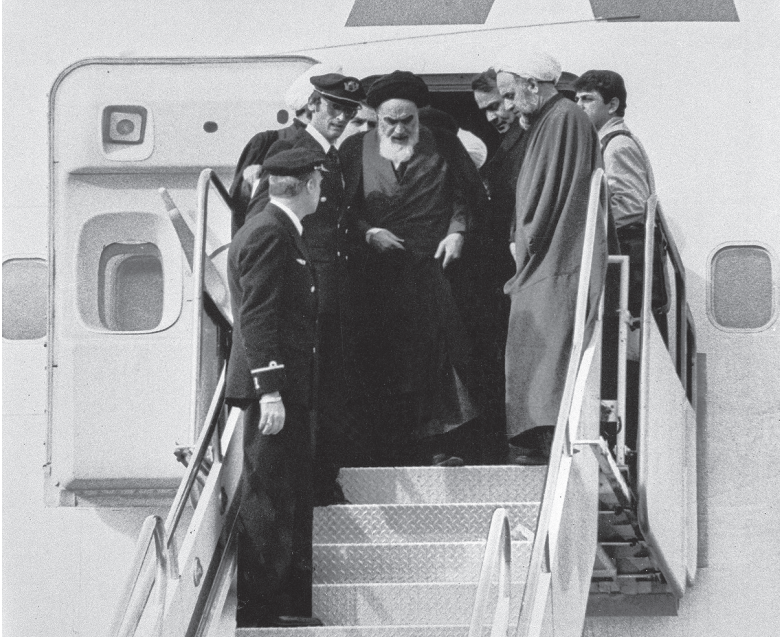
Ankunft von Khomeini in Teheran am 1. Februar 1979, wo der Geistliche von Millionen Anhängern empfangen wird.

würde, den der Schah vor seiner Abreise als Reformler eingesetzt hatte. 3 Der Flug war immer wieder verschoben worden. Als beim Anflug kurzzeitig ein Triebwerk ausfiel und auch die Landung nicht gleich klappte, glaubten viele schon an einen Anschlag. Der Flughafen selbst war vom Militär weiträumig abgeriegelt und das iranische Fernsehen durfte nur fünf Minuten berichten. Neben einigen Geistlichen warteten auch hier einige hundert internationale Journalisten, um den «historical moment», so ein US-amerikanischer Fernsehreporter im Live-Bericht, für die Welt einzufangen. Das setzte die iranischen Machthaber weiter unter Druck. 4 Mit leiser Stimme und gestützt sprach Khomeini in die Mikrofone, dass er den sofortigen Rücktritt der iranischen Regierung und die Ausweisung ausländischer Berater verlange. Der Gegensatz zu den telegenen Politikern der modernen Mediengesellschaft hätte kaum