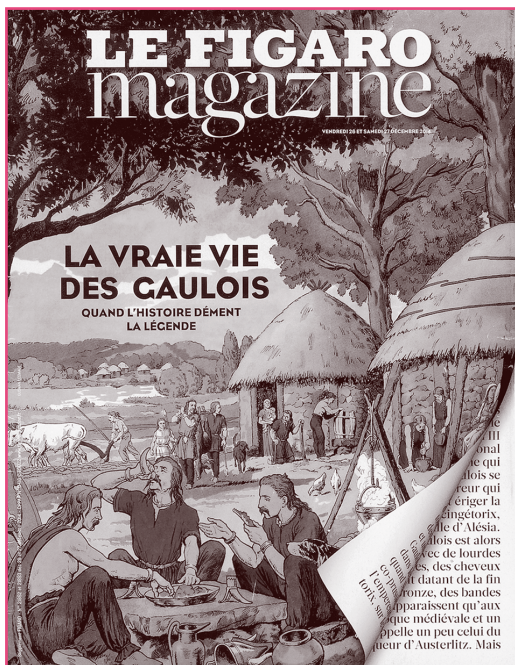
Oppida-Zivilisation aus Sicht des Figaro-Magazins

sen. Die Tiere wurden über den Felsen gehetzt und nach dem Todessprung geschlachtet – Steinzeitmetzger haben beim Abschaben des Fleisches bis heute sichtbare Einkerbungen an Pferdeknöcheln hinterlassen (ca. 8000–7000 v. Chr.). Würze erhielt das Fleisch durch an ihm klebende Aschereste – eine Vorläufertechnik für in Asche gewälzten Käse ( fromage cendré )? Die Ausbeutung von Salzquellen, Minen und Meersalzsalinen und damit verbundener Salzhandel ist spätestens seit der Jungsteinzeit nachweisbar.