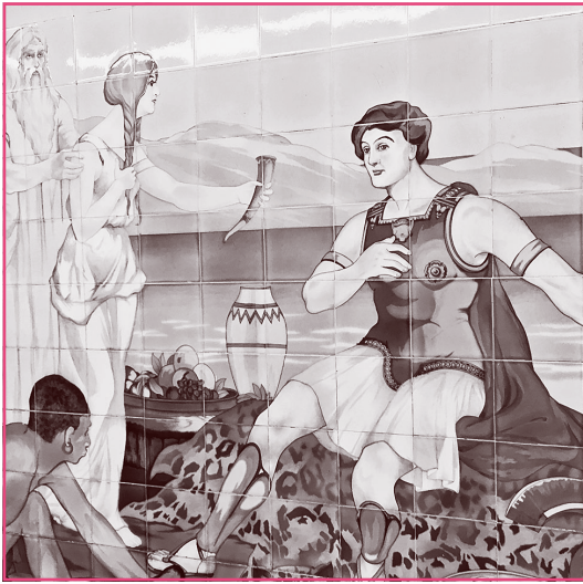
Eheanbahnung à la gauloise. Gyptis reicht Protis den Vermählungsstrunk.

die Gallier einen zivilisierten Lebensstil, und sie gaben ihre barbarische Lebensweise auf. Sie begannen ihre Felder zu bestellen und ihre Städte mit Mauern zu umgeben. Sie gewöhnten sich sogar daran, nach Gesetzen zu leben, statt Waffengewalt zu gebrauchen, und begannen, Weinreben und Oliven anzubauen. Ihr Fortschritt im Verhalten und Wohlstand war so großartig, dass es aussah, als wäre Gallien ein Teil Griechenlands, und nicht, als hätte Griechenland Gallien kolonisiert.» Analysen von Speiseresten haben ergeben, dass vor 2500 Jahren wohl schon ein Vorläufer des französischen Nationalgerichts à la grecque geköchelt wurde: Huhn, aus Kleinasien durch die Phokäer nach Südfrankreich eingeführt, in griechischem Wein geschmort. Der erste coq au vin !