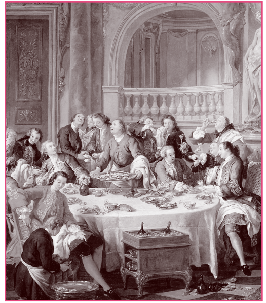
Das Austernfrühstück. Gemälde von Jean-François de Troy, 1735

Gutes anständiges Essen als Menschenrecht? 1787 hatte der englische Reisende Arthur Young stauend notiert: «Einem Franzosen scheint es lächerlich, ohne Serviette zu speisen. Auch ein französischer Zimmermann hat seine Serviette und seine eigene Gabel.» In einer Pariser Institution wie dem Suppenküchen-Palast Bouillon Chartier im 9. Ar-