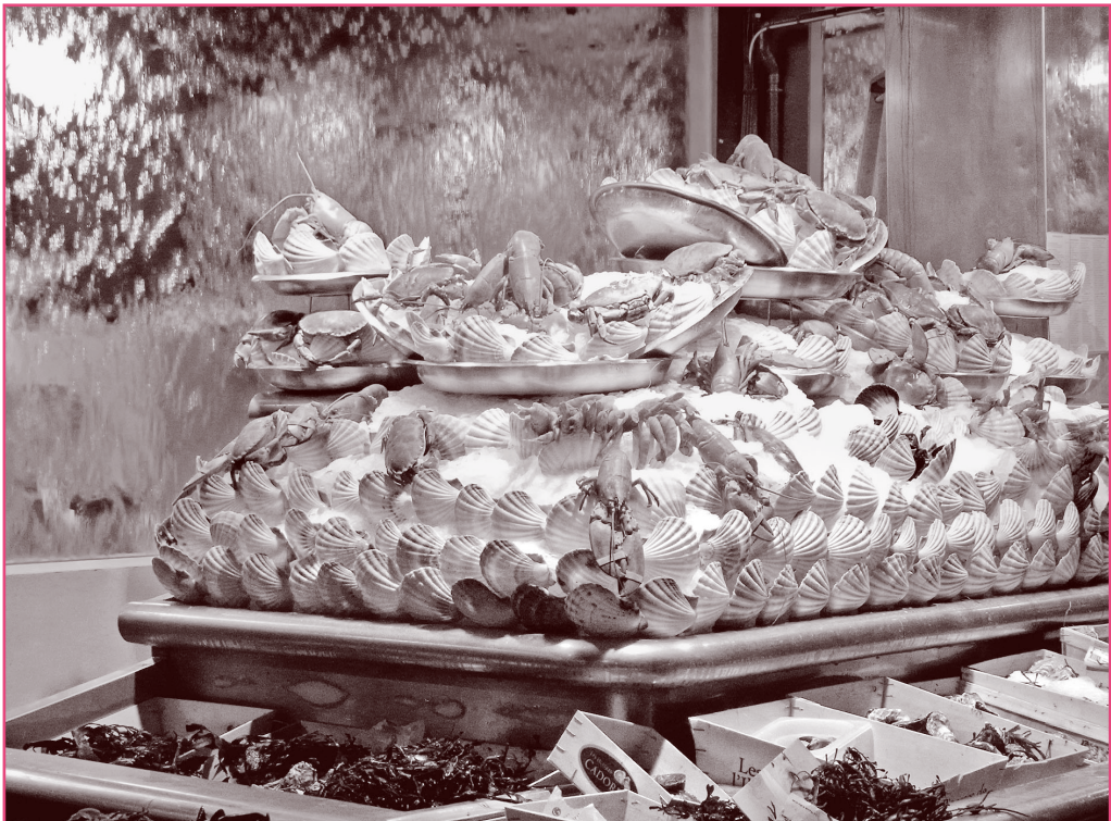
Beim Écailler: drapierte Meeresfrüchte

Das hat hochaktuelle Konsequenzen. Unverkennbar ist im öffentlichen Diskurs eine breit aufgestellte résistance culinaire gegen die globale Einebnung des gastronomischen Erbes, gegen malbouffe und austauschbares Fastfood ohne regionalen Bezug auszumachen. Ökologisches Verantwortungsbewusstsein und eher egozentrische Gourmetwünsche finden zu einer überraschenden, aber effektiven Allianz zusammen: Iss gut und sprich darüber! Es ist dieser