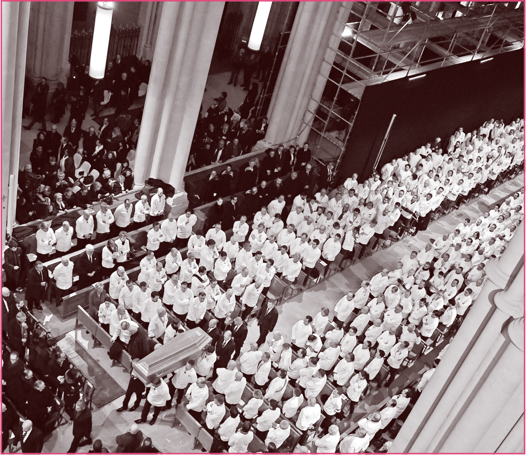
Die weißen Brigaden trauern um Paul Bocuse. Kathedrale von Lyon 2018