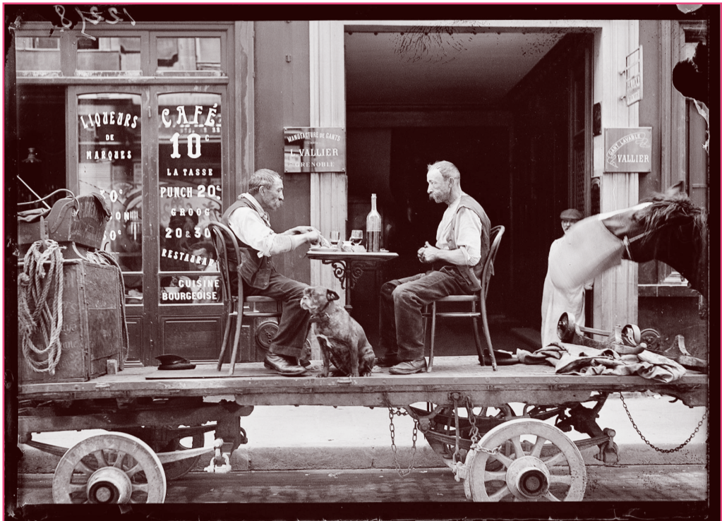
Pariser Arbeiter und Pferd bei der Mittagspause, 1917