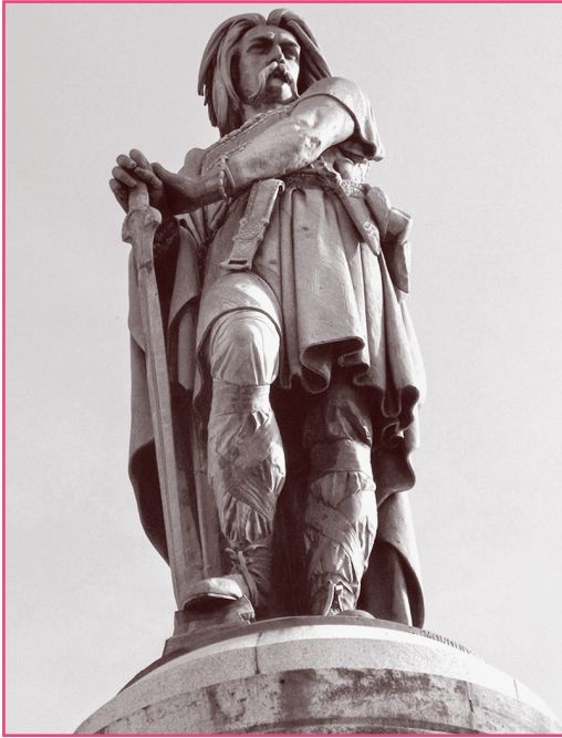
Nationalheld: Vercingetorix-Koloss in Alise-Sainte-Reine, 1864

Die geographische Silhouette von La France viticole , der modernen Weinbaunation Frankreich, ist bereits in der römischen Antike vorgeprägt. Die zukunftssträngige Technologie des robusten Holzfasses statt der zerbrechlichen Amphore (oder dem Lederschlauch) ist der entscheidende gallisch-rätische Beitrag zur Weinbauhistorie. Notfalls lassen sie sich auch als Waffen einsetzen: 51 v. Chr. rollen Freiheitskämpfer in Uxellodunum zur Verblüffung der Verteidiger brennende Holzfässer auf ein römisches Fort zu.