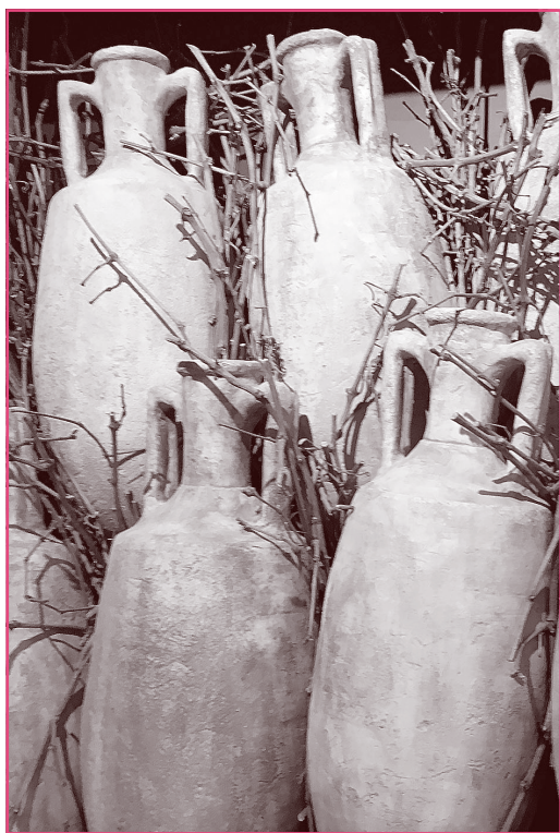
Amphorenfund im Musée d'Archéologie Méditerranéenne in Marseille.

Die definitive Unterwerfung ganz Galliens erfolgt 58–51 v. Chr. durch Caesars Truppen.