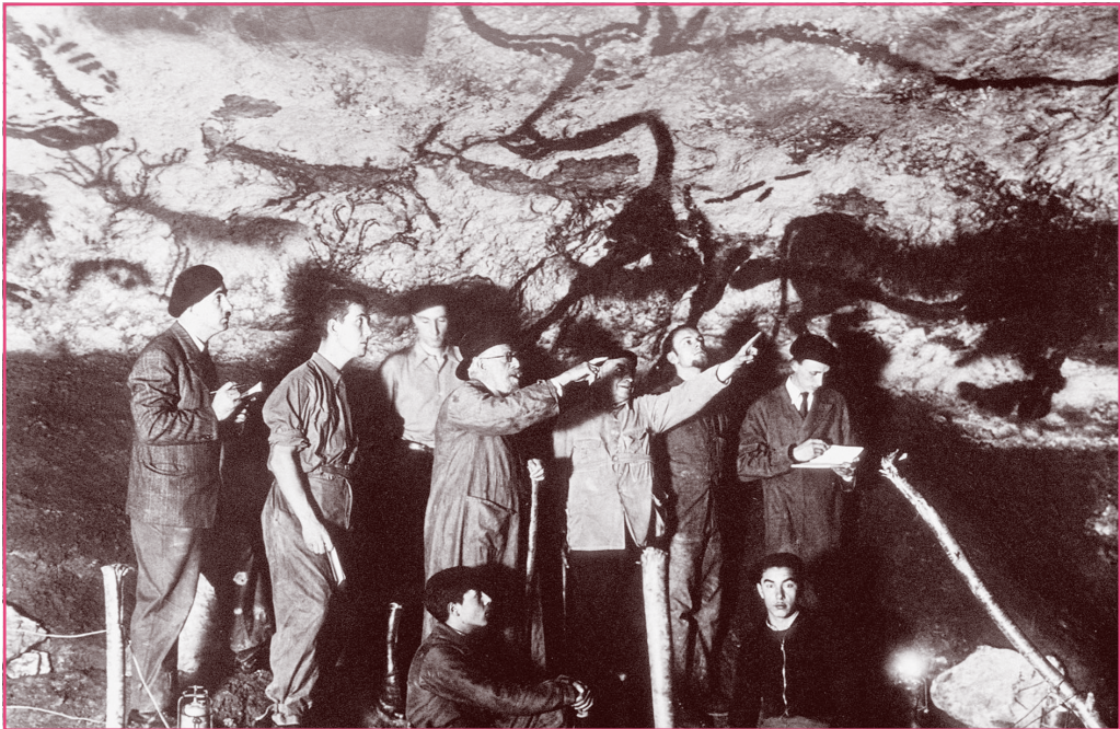
Forscherteam in der Grotte von Lascaux, historische Fotografie

Das spektakulärste Beispiel für diesen Kulturtransfer ist der 1,64 m hohe Krater von Vix. Dieses größte Mischgefäß der Antike, das theoretisch 1100 Liter Wein fassen konnte, wurde in einem nordburgundischen Frauengrab gefunden. Angesichts seiner Überdimensionalität ist er wohl eigens als Protzobjekt für gallische Kundschaft, die die Zurschaustellung öffentlicher Bankette liebte, gegossen worden. 2014 wurde in Lavau bei Troyes ein weiteres Fürstengrab freigelegt, das kostbarstes griechisches und etruskisches Trinkgeschirr, darunter eine goldgefasste attische Weinkanne, birgt. Ein euphorischer später Zeuge dieser kulinarischen Hellenisierung Südfrankreichs ist der römische Historiker Justinus: «Von den Griechen lernten