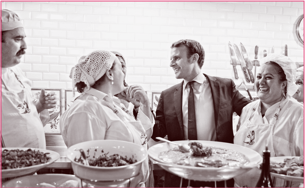
Präsident Emmanuel Macron charmiert die kochende Zunft

Dictionnaire amoureux de la cuisine ebenso alte Gemüsesorten wie Fragen, in welchen Fetten aus welchen Kartoffelsorten die besten Pommes frites frittiert werden. In diesem Angebot spiegelt sich die Vielfalt von Frankreichs Landschaften und terroirs , von Menschen, Dialekten, Küchen: Vom «Fenchelparfum» der von Gilbert Bécaud besungenen Märkte der Provence bis zu den Hummergründen der Bretagne, von den Weinstöcken des Médoc bis zu den Hirtenkäsereien der vulkanischen Auvergne. Ô terre généreuse (André Chenier), dieses hexagonale Staatsgebilde, das von Atlantik und Ärmelkanal, von Rhein und Mittelmeer umspült wird, umschließt die Gletscher Savoyens ebenso wie die burgundischen Weiden der weißen Charolais-Rinder und die Sandstrände von Pampelonne und Saint-Tropez.