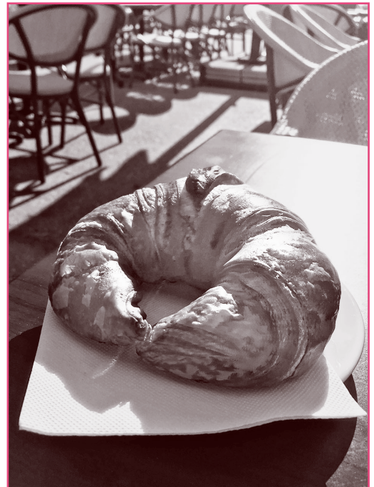
Das perfekte Croissant