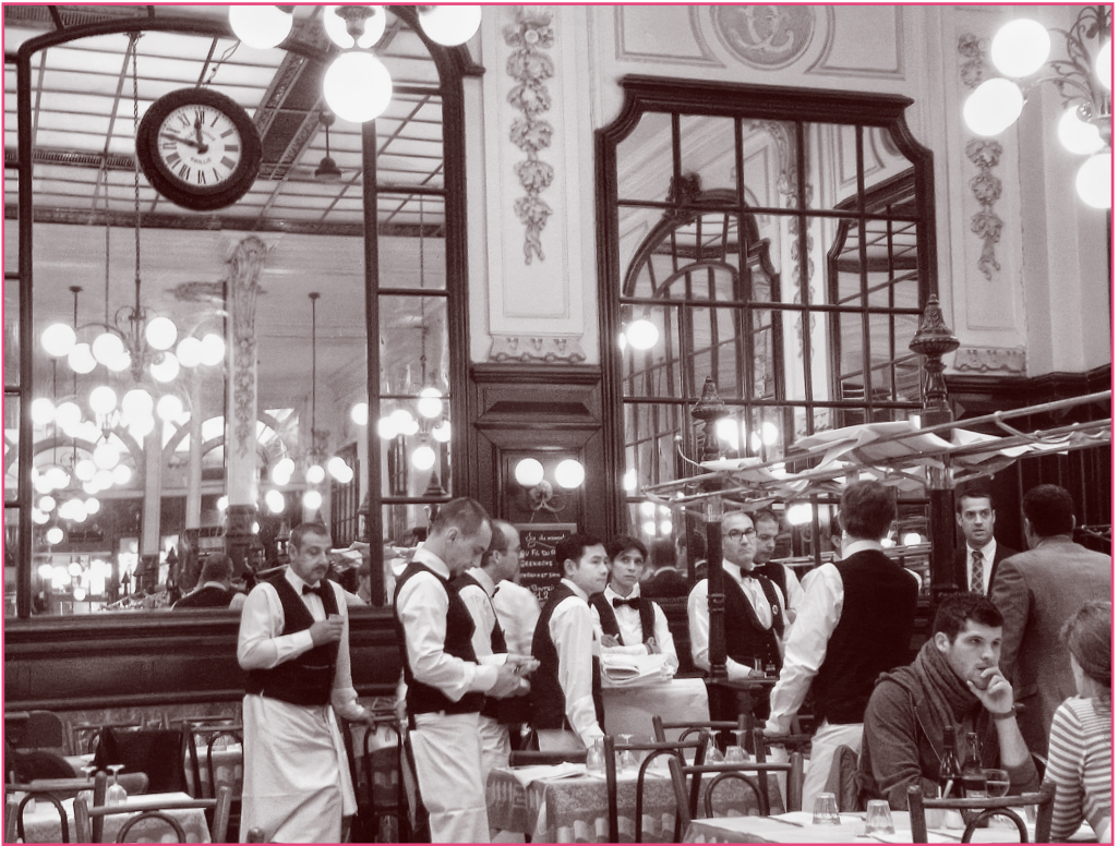
Bouillon Chartier: Stil und Qualität zum Volkspreis

rondissement starten die Preise für Entrées jedenfalls bei 1,- €, verspiegeltes Jugendstilinterieur und Oberservice comme il faut inklusive.