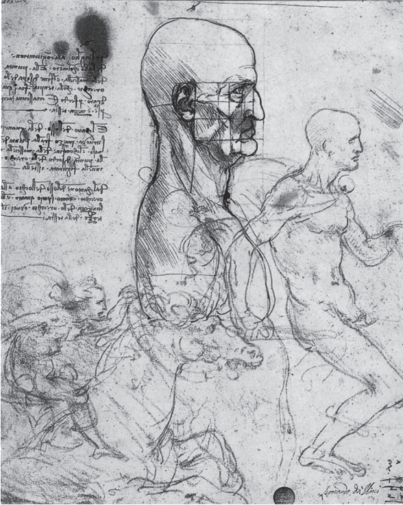
Abb. 1: Leonardo da Vinci, Proportionsstudie eines Männerkopfes (um 1503), zwei Reiter (um 1490), Feder, Tinte, Rötel und Metallstift, 28 × 22,2 cm, Venedig, Gallerie dell'Accademia.

zunächst in Händen von Leonardos Schüler Francesco Melzi (1491/93 – um 1570), wurde nach dessen Tod in alle Winde zerstreut. Erhalten ist immer noch viel, ein Bestand von gut 6000 Blättern. Die ursprüngliche Zahl mag das Fünffache betragen haben. Manche Quellen machten Passionen durch, zum Beispiel ein Konvolut, das im 17. Jahrhundert in den Besitz der Biblioteca Ambrosiana in Mailand gelangte und unter dem Namen «Codex Atlanticus» berühmt wurde. Den Namen hat es von seinem Format, den Maßen eines Atlas. Ein Vorbesitzer, der Bildhauer Pompeo Leoni (1533–1608), hatte 481 Blätter binden lassen, zuvor Zeichnungen und Texte ausgeschnitten, neu geordnet und aufgeklebt. Nach ihrer Ablösung zählt die Sammlung