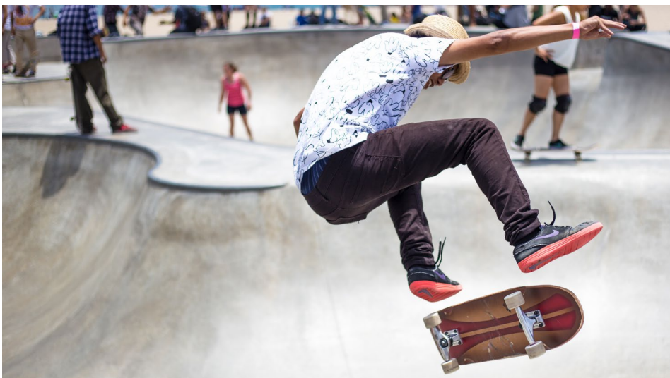
Abbildung 1-9 Durch Zeitlupen können u. a. schnelle Abläufe besser dargestellt werden

Viele spannende Abläufe gehen oftmals so schnell vonstatten, dass der Zuschauer die Details überhaupt nicht erfassen kann. Das gilt für den Sprung eines Skaters genauso wie für technische Abläufe im beruflichen Alltag. Mit Zeitlupen können Sie die ansonsten nicht erfassbaren Details zeigen und auf diese Weise tolle Bilder zaubern. Mehr Infos dazu finden Sie im Abschnitt Zeitlupe ab Seite 162.