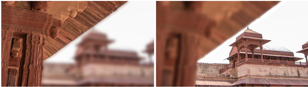
Abbildung 1-2 Schärfeverlagerung