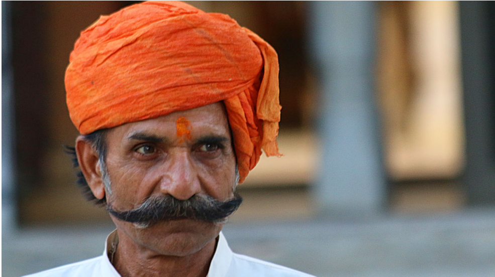
Abbildung 1-1 Unscharfe Hintergründe sind ein beliebtes Gestaltungsmittel.

Lenkt die Aufmerksamkeit auf den scharfen Vordergrund und sieht einfach auch klasse aus. Damit das rein technisch klappt, müssen vorher einige Dinge zusammenkommen. Mehr Infos dazu finden Sie in den Abschnitten Schärfe ab Seite 121, Blende bewusst einsetzen ab Seite 168 und Follow focus ab Seite 170.