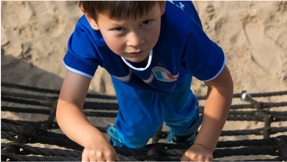
Abbildung 1-7 Ungewöhnliche Perspektiven machen Bilder spannender.

Welche Perspektiven es gibt und welche Bedeutungen mit diesen verbunden sind, erfahren Sie im Abschnitt Kamerastandpunkt (Perspektiven) ab Seite 31.