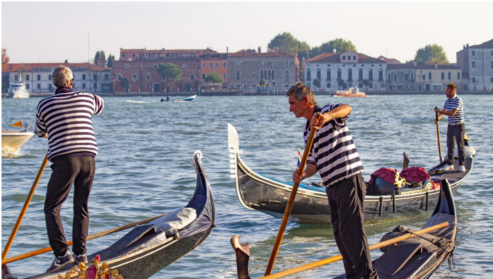
Abbildung 1-5 Bewegung ist in einem Video das A und O.