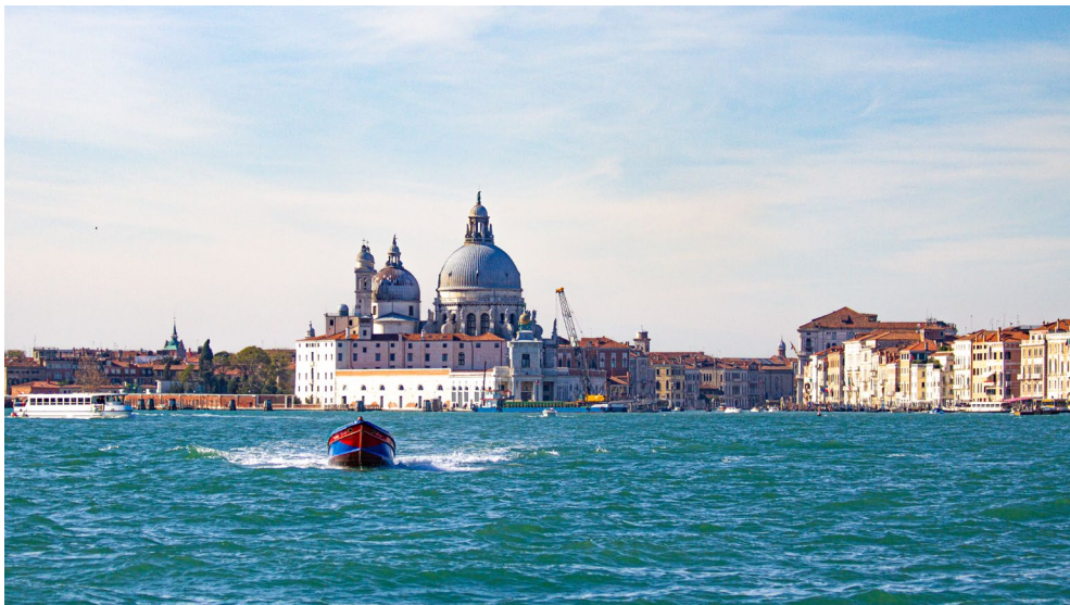
Abbildung 1-3 Das Wasser nimmt rund 1/3 des Bilds ein.

Bilder sehen oftmals ansprechender und interessanter aus, wenn das Motiv nicht mittig angeordnet wird. Hierzu teilen Sie das Bild jeweils horizontal und vertikal in je drei Teile auf. Auf diese Weise ergeben sich vier Schnittpunkte. Sie platzieren das Motiv dann auf oder in der Nähe von einem von ihnen. Sie können das Bild auf diese Weise auch bequem aufteilen (z. B. in 2/3 Himmel, 1/3 Landschaft). Orientieren Sie sich dazu im Zweifelsfall an den einblendbaren Hilfslinien im Sucher oder auf dem Display Ihrer Kamera. Mehr Informationen dazu finden Sie im Abschnitt Kameraausrichtung optimieren ab Seite 124.