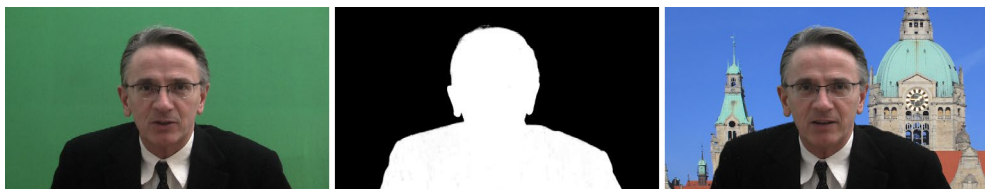
Abbildung 1-10 Grüne Farbe »ausstanzen« und das Bild vor einem Hintergrund einfügen

Dann darf ich Ihnen empfehlen, sich zunächst einmal den gleichnamigen Abschnitt ab Seite 260 durchzulesen. Bereits beim Dreh entscheidet sich, ob Ihr Vorhaben klappt oder ob Sie an der Nachbearbeitung Ihrer Aufnahmen »verzweifeln« – etwa, weil die freigestellte Person plötzlich Löcher im Körper hat, durch die der farbige Hintergrund durchscheint.