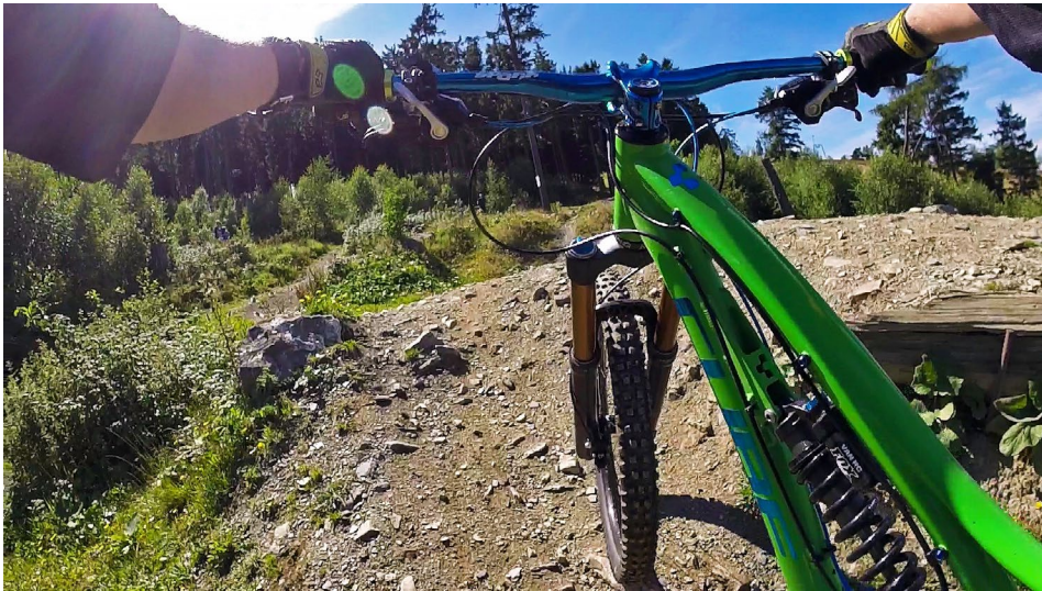
Abbildung 1-8 Action-Cams sind fast überall dabei.