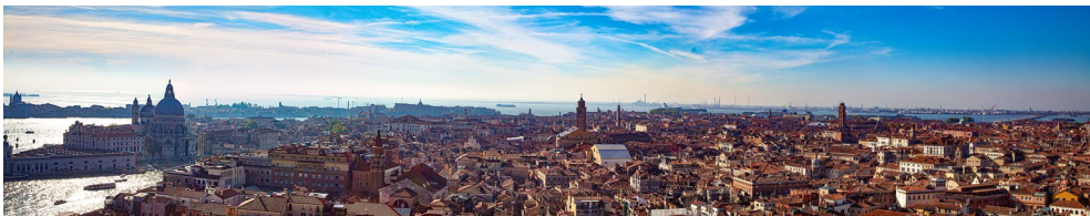
Abbildung 1-6 Manche Bilder lassen sich nur mit einem Schwenk einfangen.

Manchmal lässt sich nicht alles direkt abbilden. Mit einem Kameraschwenk oder einer Kamerafahrt bekommt man das Bild aber dennoch in den Kasten. Auf welche Aspekte Sie dabei achten sollten, erfahren Sie in den Abschnitten Schwenks ab Seite 37 und Kamerafahrten ab Seite 41.