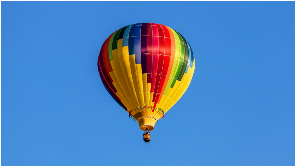
Abbildung 1-4 Wenn die Filmidee nicht in eine andere Richtung geht, machen sich kräftige Farben immer gut.

Über die Wirkung von Farben gibt es unendlich viele Abhandlungen. Im Videobereich machen sich knackige Farben immer gut. Wenn Sie Einfluss auf die Gestaltung des Motivs bzw. Sets haben sollten und Ihre Filmidee es hergibt, sollten Sie in dieser Hinsicht aktiv werden und für Farbe sorgen. Platzieren Sie Ihre Kinder beispielsweise lieber vor einer farbigen Tapete, also vor einer weiß verputzten Wand, oder sorgen Sie zum Dreh dafür, dass Ihre Darsteller farbig statt grau in grau gekleidet sind.