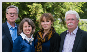
Die Herausgeber*innen (v. l. n. r.)