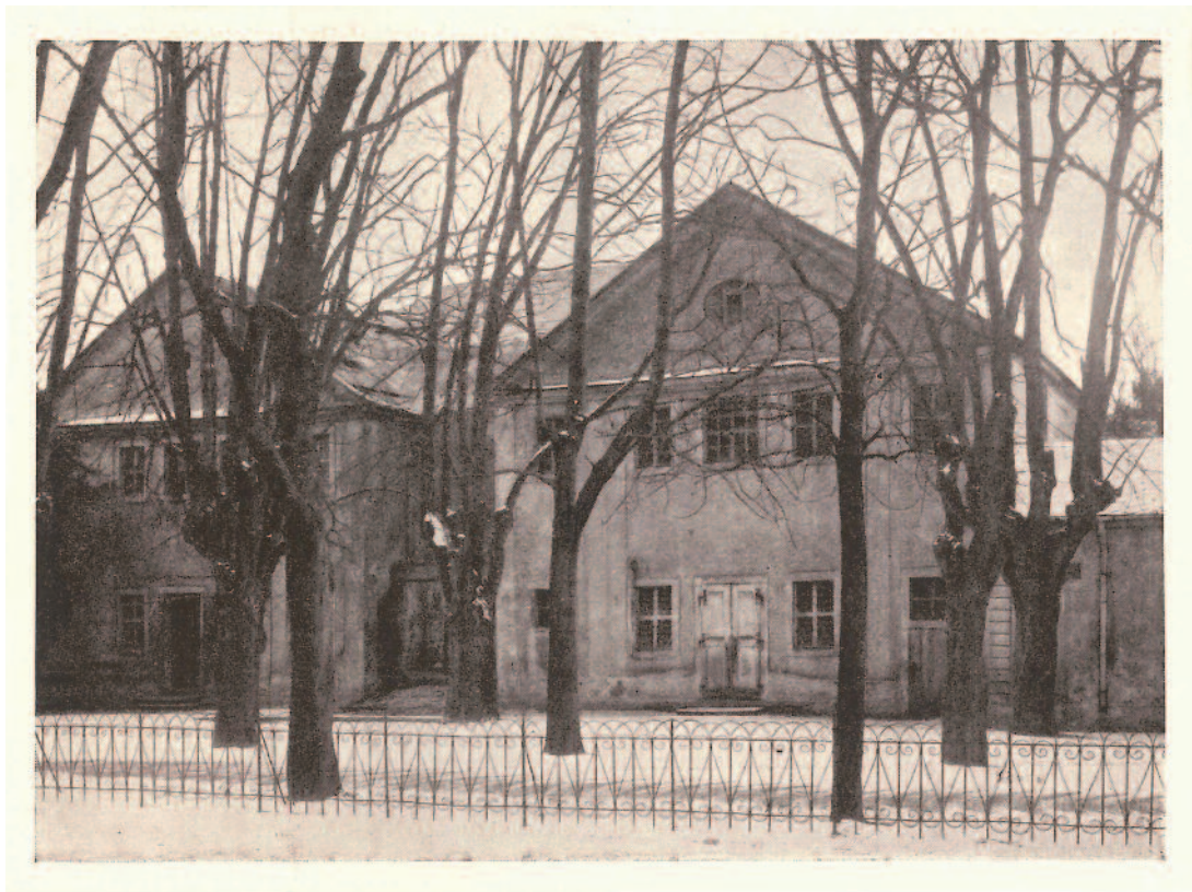
Das alte Hoftheater im Schlossgarten (1671–1864). Es wurde 1904 abgerissen.