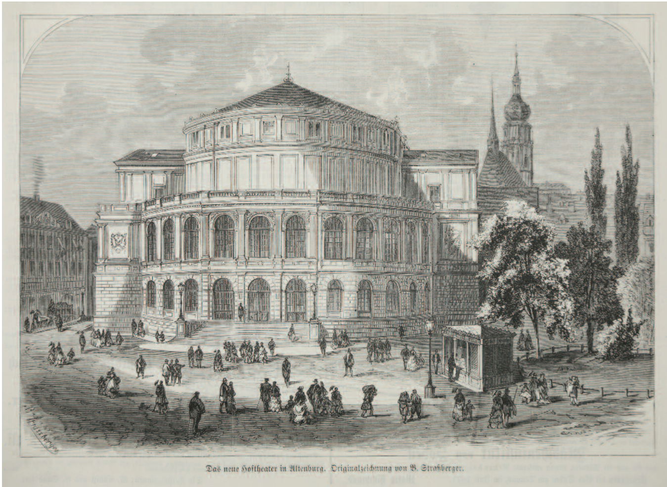
Frontansicht des Herzoglichen Hoftheaters Altenburg, 1871