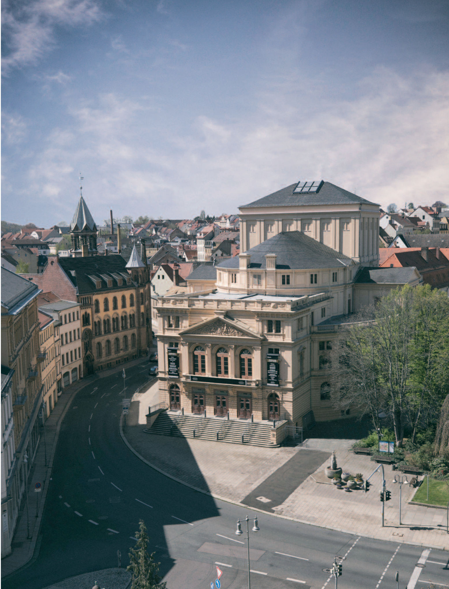
Frontansicht des Theaters Altenburg, 2020